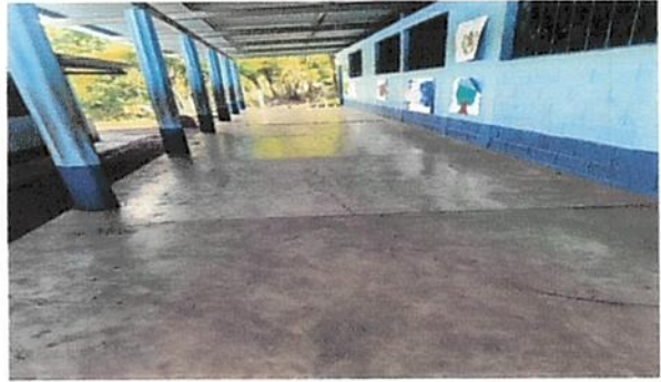
Foto 2: Suministro e instalacion de ventanas pvc en 4 aulas direccion y aula de parvulos ✓