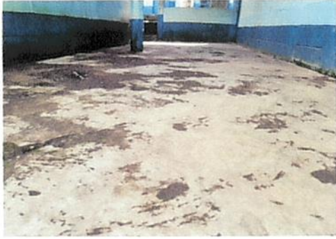
Foto1: Instalacion de piso de granito ✓