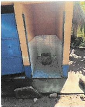
Foto 5: Sustuticion de letrinas por letrinas de fibra de vidrio ✓